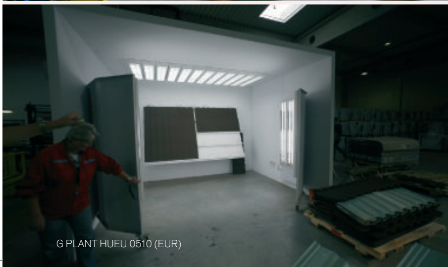
G PLANT HUEU 0510 (EUR)

Az AHI Roofing Ltd. örömmel jelenti be, hogy megnyitotta európai gyárát Magyarországon, ahol a Gerard® tetőcsalád termékeit állítja elő. Az üzem Várpalotán, Nyugat-Magyarország egyik iparvárosának ipari parkjában épült fel.